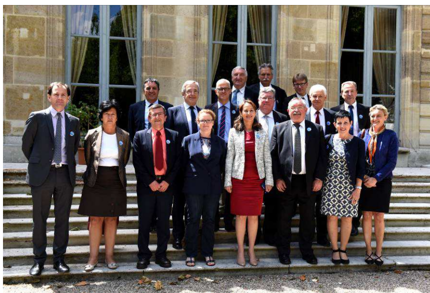
Bernard Suard – MEDDE

Ségolène Royal a signé hier avec les élus lauréats dix conventions d'appui financier aux programmes des territoires à énergie positive pour la croissance verte. Ils bénéficieront de 500 000 € pour engager des actions concrètes sur le terrain. En Limousin, deux élus ont présenté leur plan d'action, pour les territoires de la communauté d'agglomération Limoges métropole et de la communauté d'agglomération du Grand Guéret.