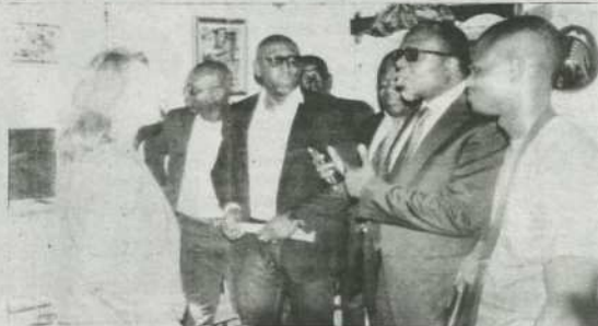
Le ministre Abli-Bidamon (2° à droite) et l'équipe technique donnent des informations sur le projet «Cizo».