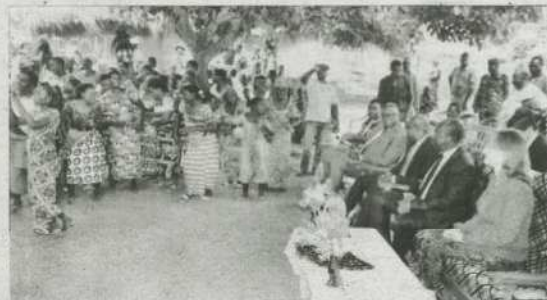
Accueil enthousiaste dans le village Zooti Attikondji.