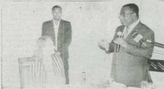
Le premier ministre Komi Selom Klassou félicite l'hôte française pour l'accompagnement du développement énergétique du Togo.