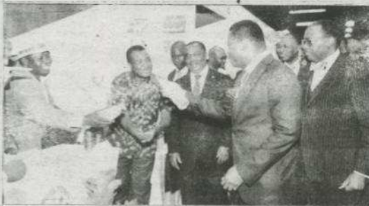
Le chef de l'Etat Faure Essozimna Gnassingbé devant un stand du MIFA.

Le chef de l'Etat Faure Essozimna Gnassingbé a officiellement lancé lundi, au Centre Togolais des Expositions et Foires (Togo 2000), le Mécanisme Incitatif de Financement Agricole (MIFA), en présence des membres du gouvernement et des partenaires techniques et financiers. Devant le président de la République, plusieurs conventions ont été signées entre le MIFA, les producteurs, les banques, les assurances, les fonds de garantie, les importateurs d'intrants et la Brasserie BB Togo.