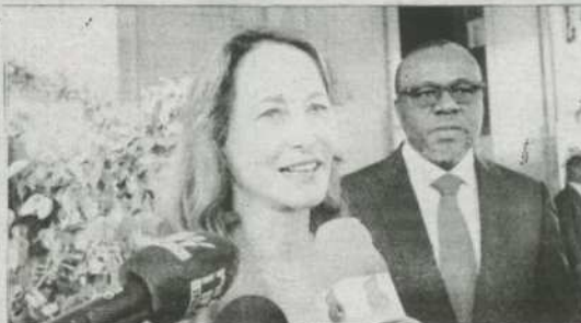
Mme Ségolène Royal a salué la politique nationale d'électrification du Togo.

exemplaire de l'ASI parce qu'il a fait l'un des meilleurs plans de projection de raccordement à l'électricité notamment solaire. Le pays prévoit le raccordement de toute la population à l'électricité à l'horizon 2030. C'est un projet très concret avec une feuille de route très opérationnelle », a indiqué Mme Ségolène Royal à l'issue de l'entretien.