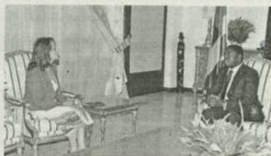
Echanges entre Mme Royal et Faure Gnassingbé

Le projet a été élaboré par le ministère des Mines et de l'Energie avec le soutien de la Société financière internationale. Cette stratégie marque la volonté politique du gouvernement de réaliser l'accès à l'électricité pour