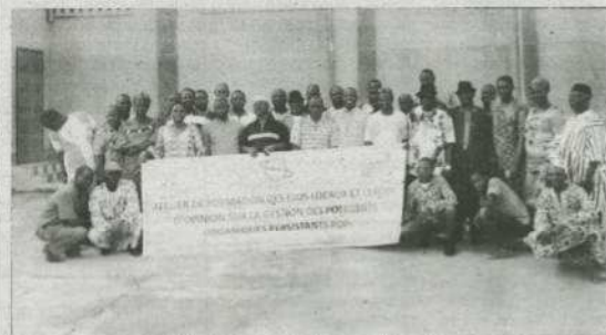
Photo de groupe à l'issue de l'ouverture.

Un atelier de formation des élus locaux et leaders d'opinion sur la gestion des substances chimiques et les Polluants